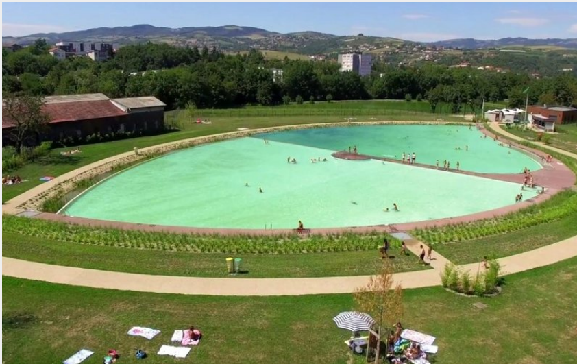
Baignade naturelle de Lorette située à 6 kms du gîte