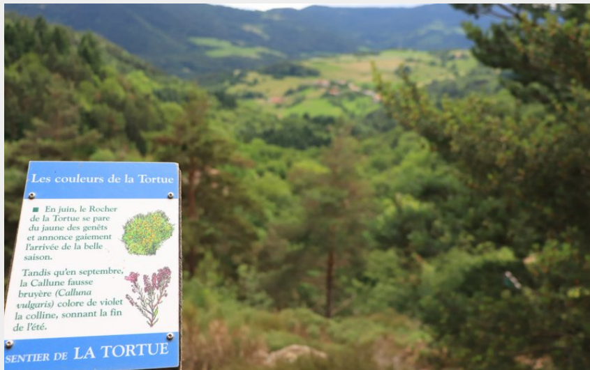
Crédit : Sentier d'interprétation de la Tortue - boucle de 700m_Bourg-Argental (Joséphine Mona)