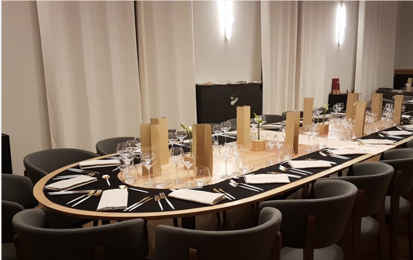
Crédit photo : Hotel restaurant Ecllosion (Hotel restaurant Ecllosion)