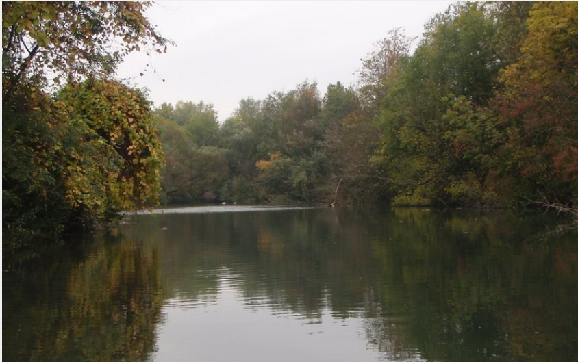
plan d'eau de l'île de la chèvre