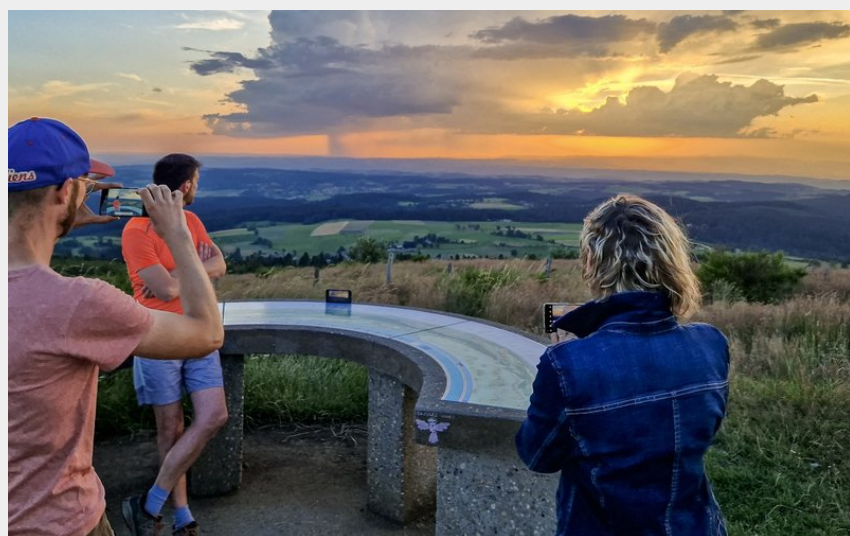
Séance coucher de soleil de fin d'atelier photo