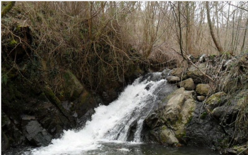
Crédit : Pêche dans la rivière Batalon_Malleval