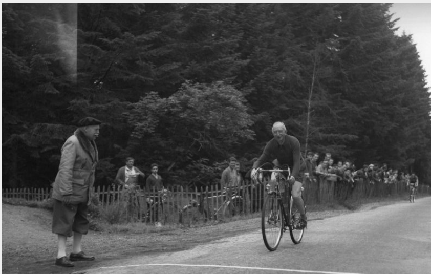
le Col de La République