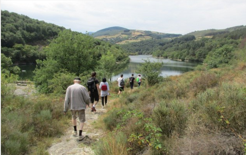
Arrivée au Bge du Couzon (P Arnaud Parc du Pilat)