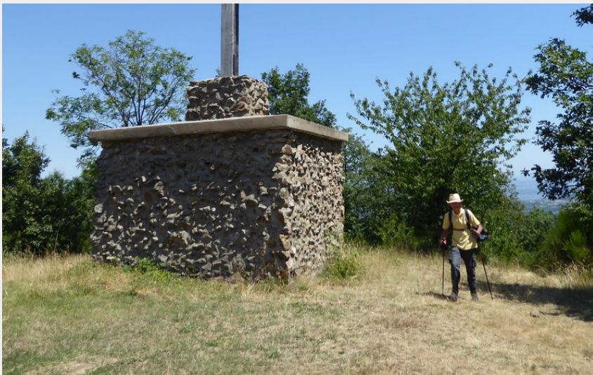
Croix de Ste Blandine (P Arnaud Pnr Pilat)