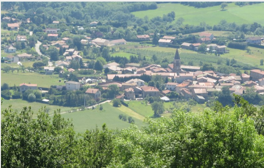
Vue du village