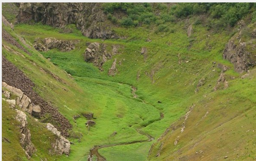
Queue du lac de barrage du Gouffre d'Enfer (Guillaume Chorgnon)