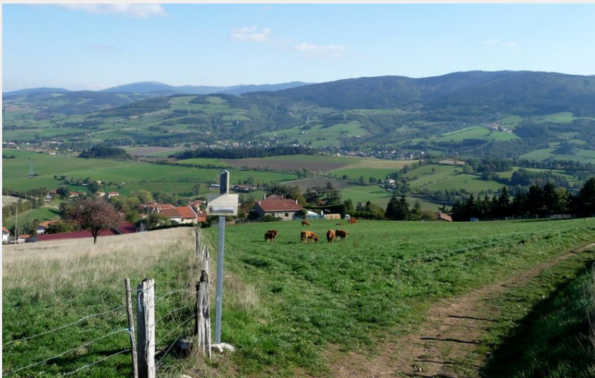
(Mairie de Saint Jean Bonnefonds)