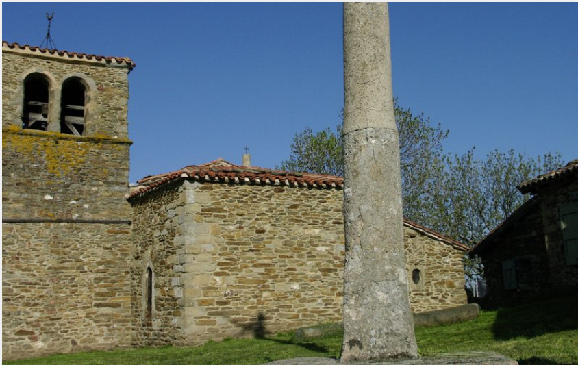
La Chapelle de Jurieux (J M Chauvet)