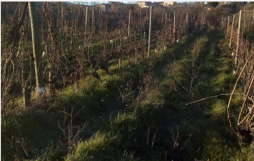
Vigne (D Sauvignet)