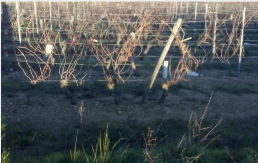
Vue sur le Rhône (D Sauvignet)