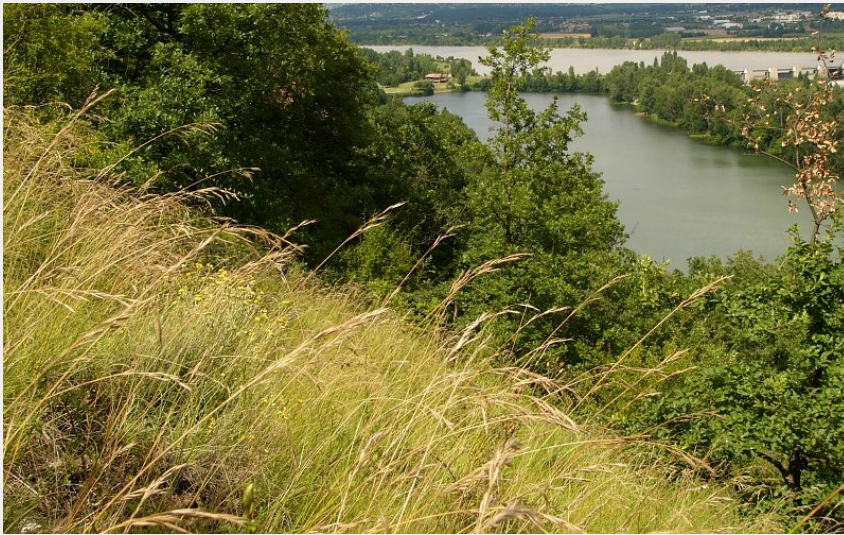
Vue du plan d'eau (Parc du Pilat)