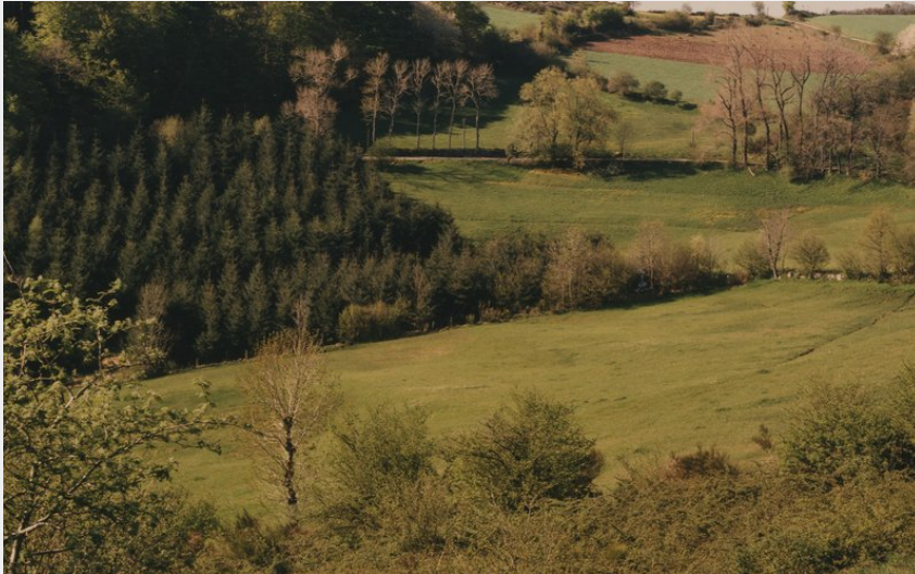
La Croix du Trève (M Fropier PN)