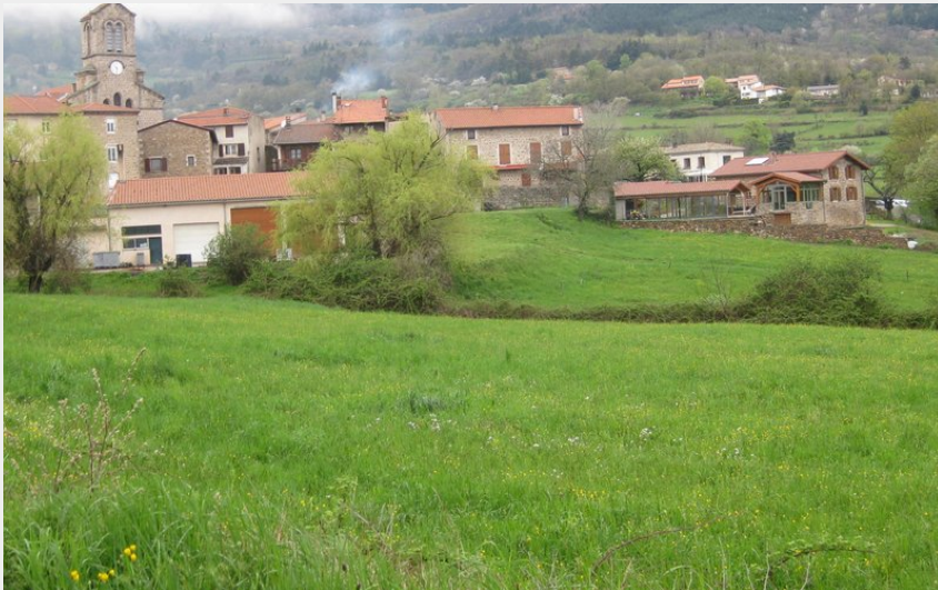
Vue du village