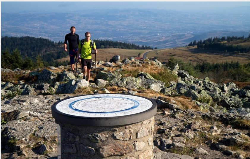
Table d'orientation du crêt de la Perdrix (Basalt Image)