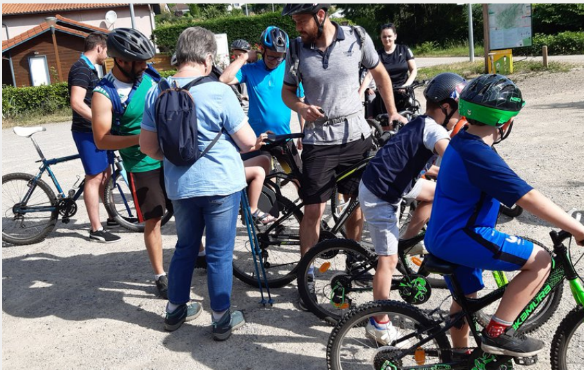
Départ du circuit (Pascal Arnaud)