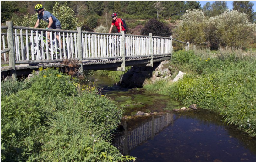
Etang du Garry (Basalt image)