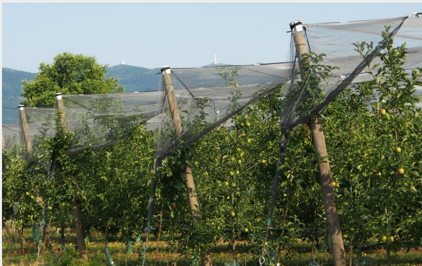
Vergers de pommiers (Michel Jabrin)