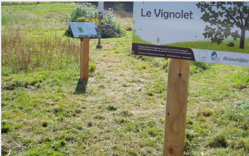
Refuge LPO du Vignolet (P Arnaud Parc du Pilat)