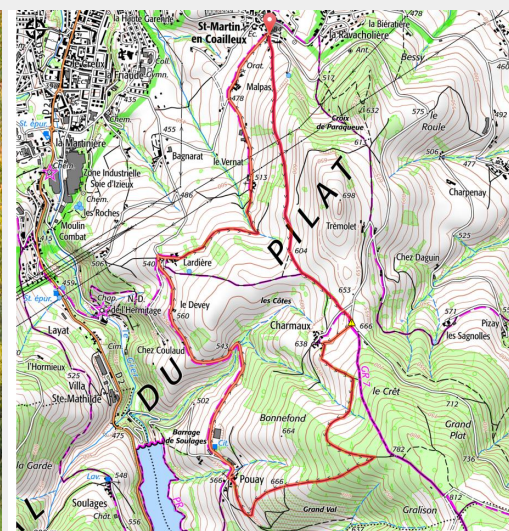
Entre Lardière et le Vernet (G Chorgnon Parc du Pilat)

Belle balade au départ de St-Martin en Coailleux avec un passage au dessus du barrage de Soulage.