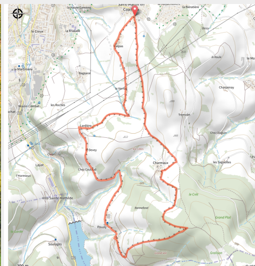
Entre Lardière et le Vernet (G Chorgnon Parc du Pilat)

Belle balade au départ de St-Martin en Coailleux avec un passage au dessus du barrage de Soulaget.