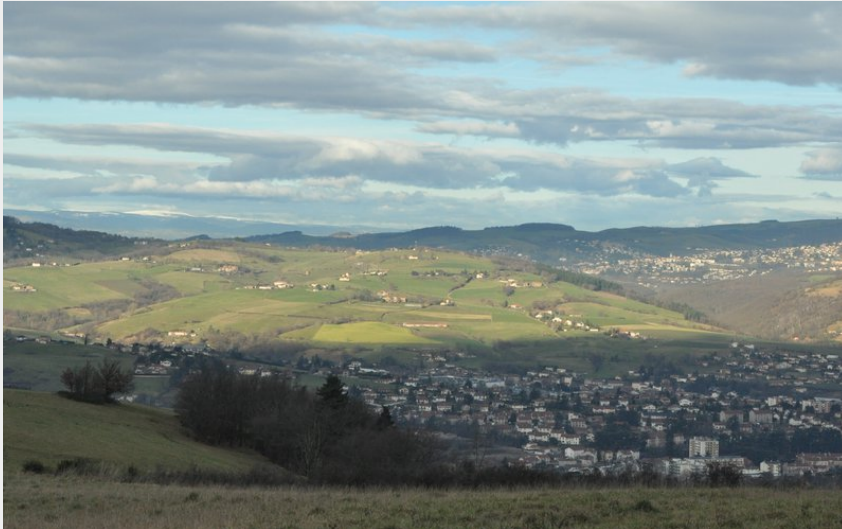
Vue sur Saint-Chamond et les monts du Lyonnais depuis Charmaux (G Chorgnon Parc du Pilat)