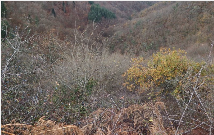
Vallée du valchérie (P Arnaud Parc du Pilat)