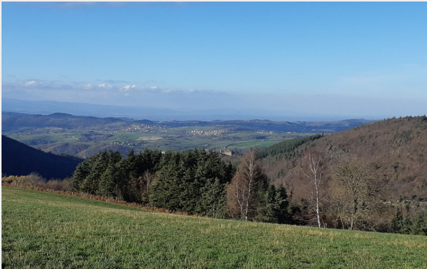
vue sur le Château de Feugerolles (jacky Pichon)