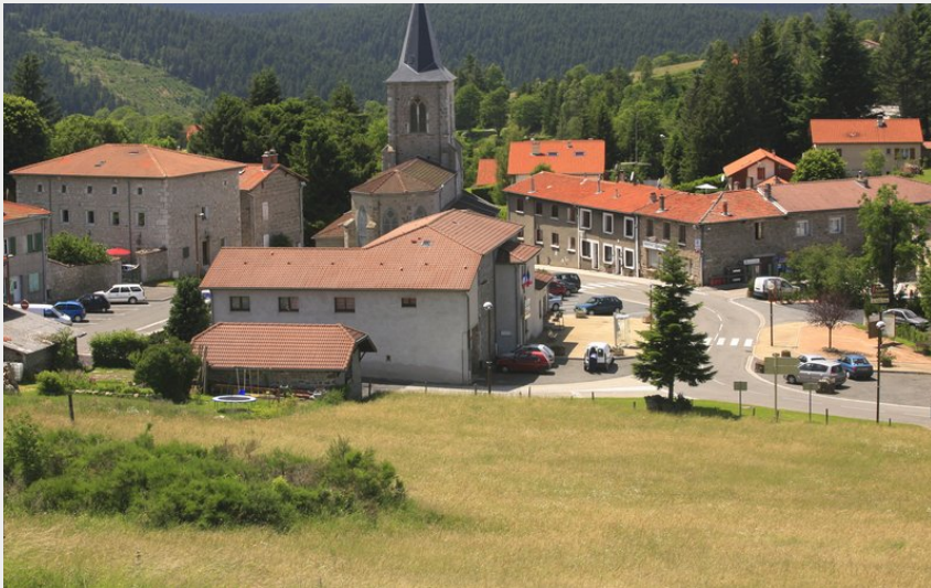
Le village (Mairie de Tarentaise)