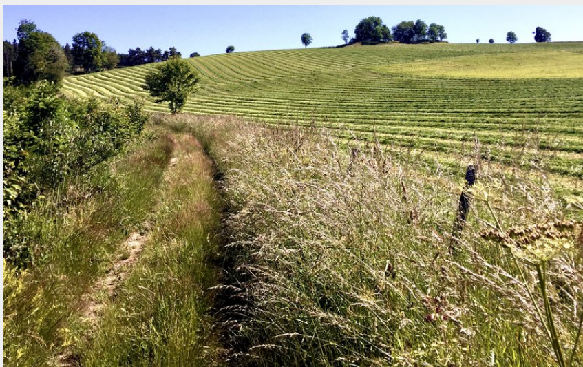
(Mairie de Marlhes)