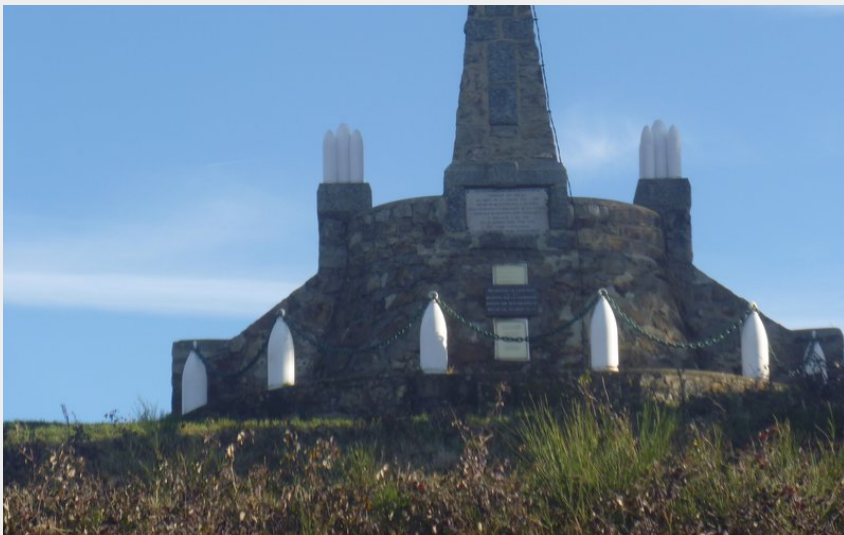
(Mairie La Terrasse sur Dorlay)