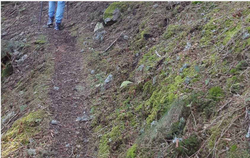
Arrivée au Sapin Géant (N Morelon)