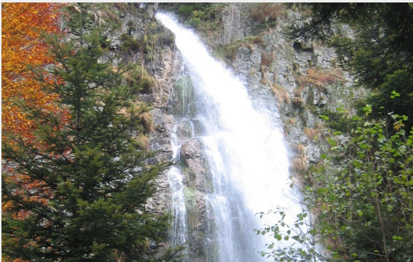
(P Arnaud Pnr Pilat)