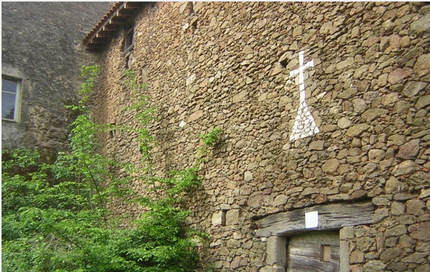
(Mairie de Pavezin)