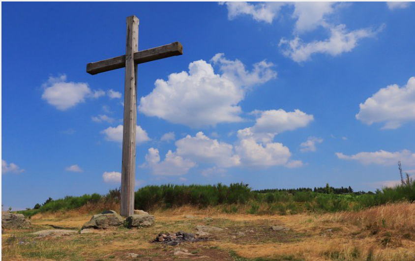
Croix de Chaussitre (Josephine Mona)