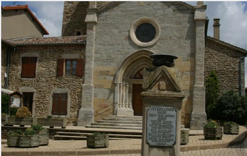
Fontaine sur la place de l'église à Longes (Carole Mabilon)