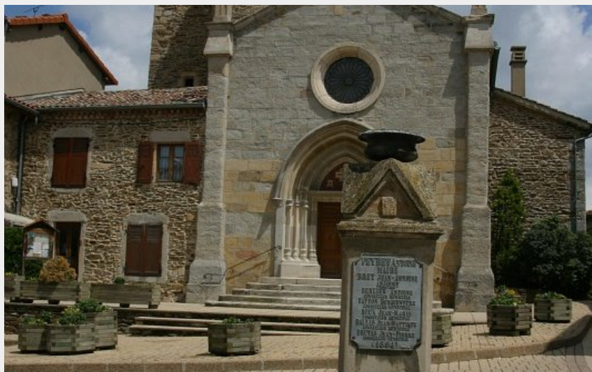
Fontaine sur la place de l'église à Longes (Carole Mabilon)