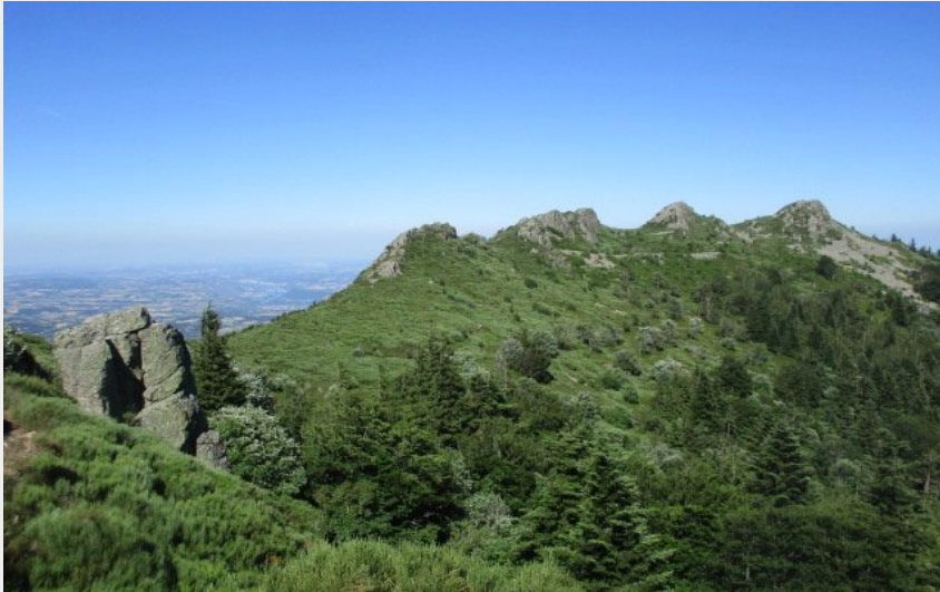
Les Dents (N Morelon)