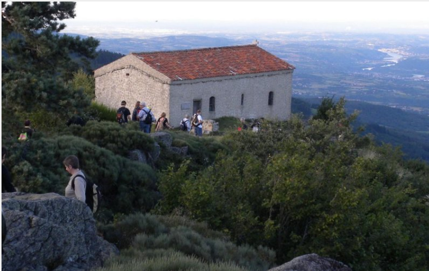
Chapelle Saint-Sabin (Mairie Colombier - Nicole Morelon - Carole Mabilon)