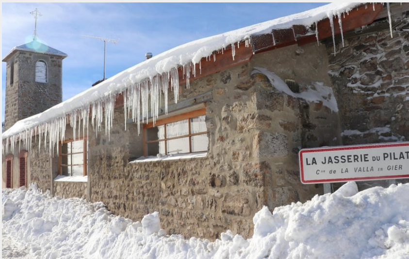
La Jasserie enneigée