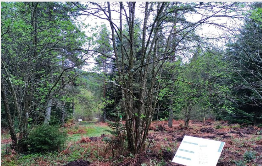
Mobilier d'interprétation de la tourbière (P Araud Pnr pilat)