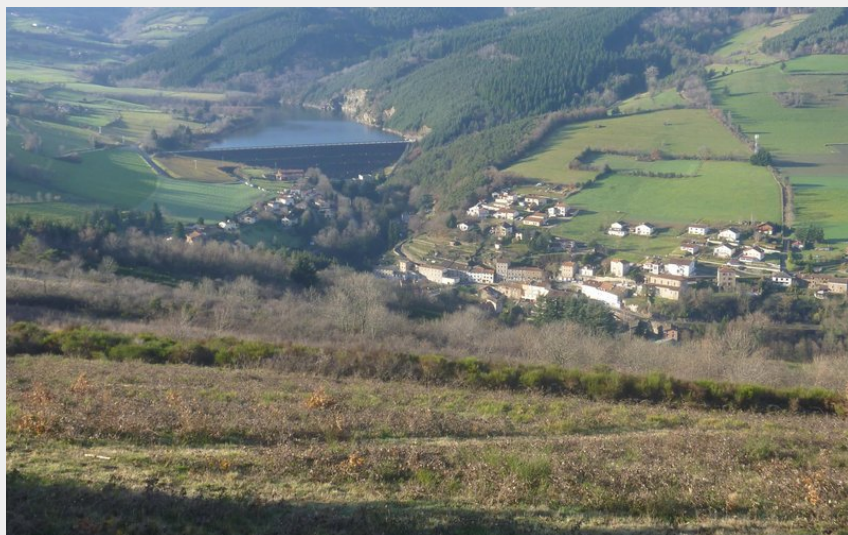
(Mairie la Terrasse sur Dorlay)