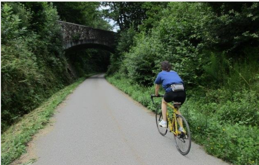
La Via Fluvia (P Arnaud)