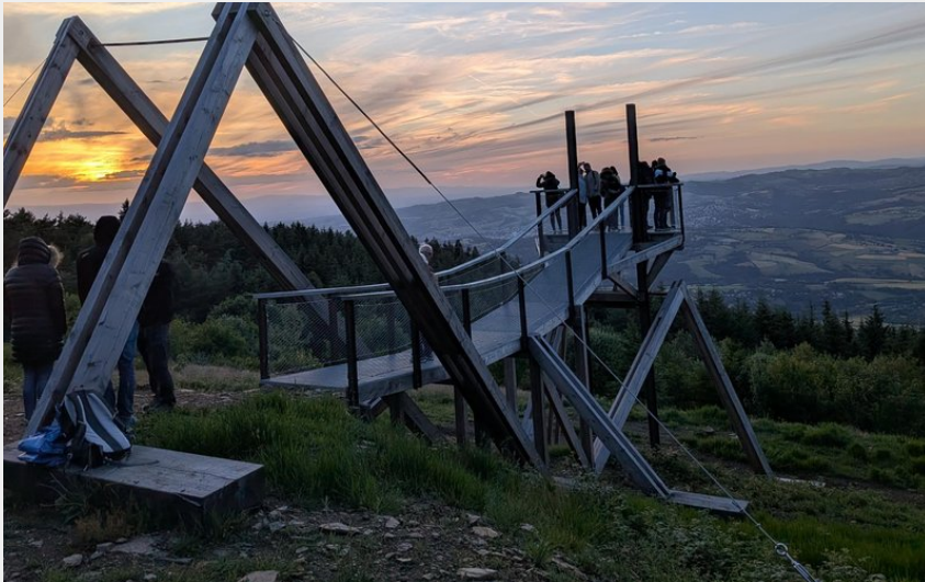
Table de lecture du paysage (P Arnaud)