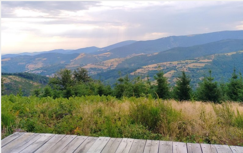
Point de vue sur La-Valla-En-Gier (P Arnaud)