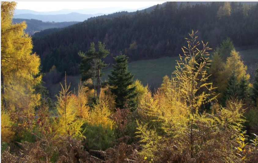
Paysage d'automne (Mairie Colombier)