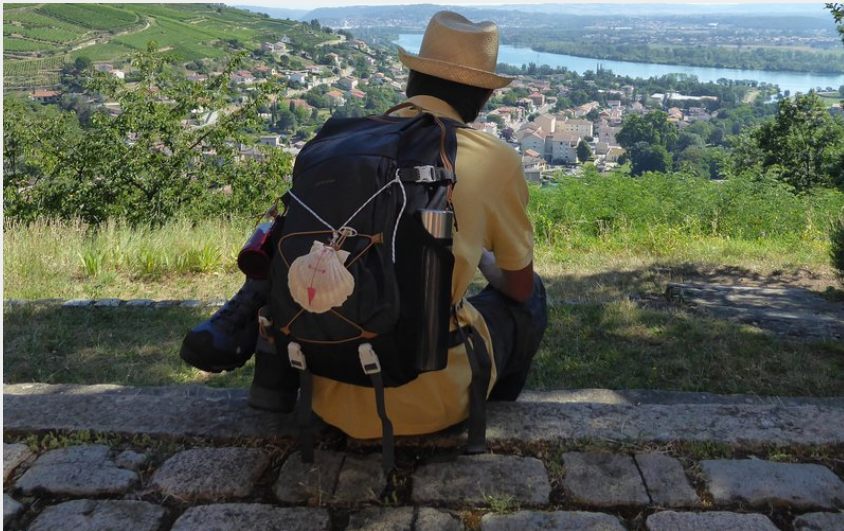
Vue de la Chapelle (P Arnaud Pnr Pilat)