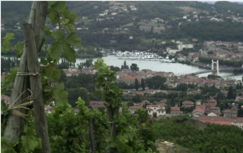
(Mairie de Condrieu)