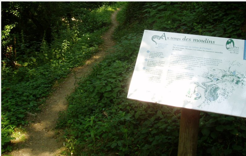
Panneau d'interprétation (pamaud)