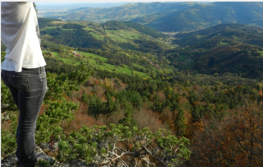
Vue de la Grotte Sarrazine (N Morelon)